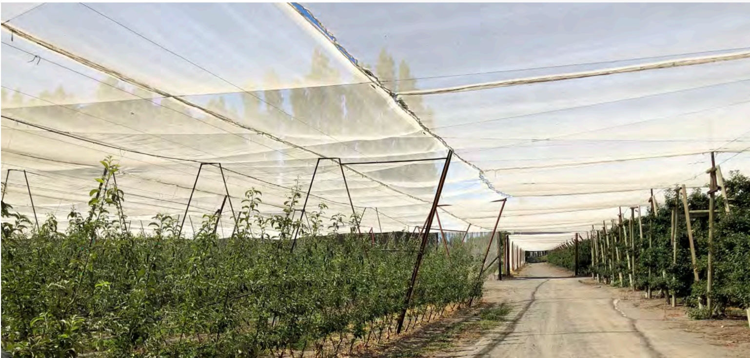
Toile d'ombrage sur un verger de pommiers

La sous-capitalisation des exploitations agricoles est un autre élément qui nuit à l'offre de produits, car elle limite les investissements et les efforts visant à améliorer les terres. Ces deux éléments sont nécessaires à l'utilisation optimale des ressources critiques, à la préservation de la qualité des sols et de l'eau, et à la conservation, voire même à l'augmentation de la capacité productive des terres.