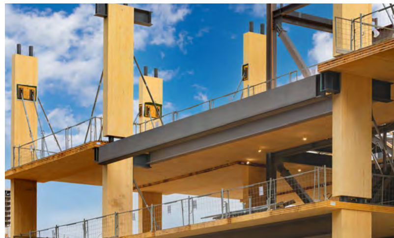
Exemple de produits en bois d'ingénierie

Les crédits-carbone représentent une autre source de demande distincte en terres forestières, et le retrait permanent du bois disponible dans la base d'approvisionnement. Ils peuvent être générés par le report d'une récolte ou une amélioration à la gestion forestière, ou par la plantation d'arbres sur des terres non boisées. Le carbone capturé par les arbres pendant leur croissance est quantifié selon un équivalent de tonne de CO 2 par des organismes de certification indépendants. Les unités d'émission de CO 2 ainsi créés sont ensuite vendues aux acquéreurs qui souhaitent volontairement compenser leur empreinte carbone ou qui sont contraints de le faire aux termes de systèmes de plafond et d'échange établis par les organismes de réglementation.